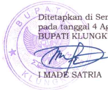
I MADE SATRIA

Ditetapkan di Semarapura pada tanggal 4 Agustus 2025 BUPATI KLUNGKUNG,